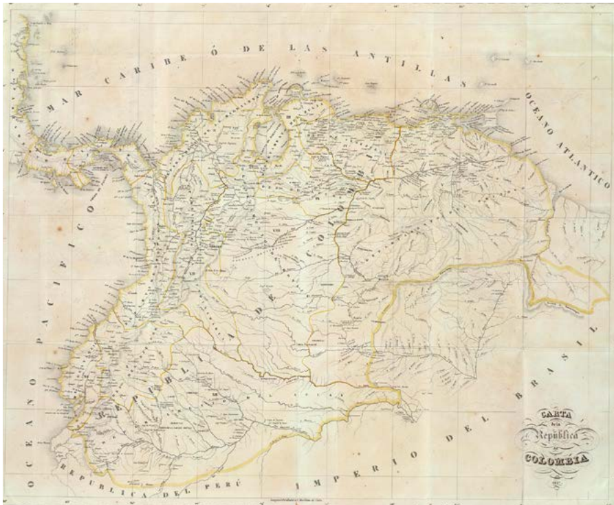
Departamentos de la Gran Colombia entre 1824 y 1830.