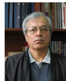
Por: Oswaldo Encalada Vásquez Universidad del Azuay Academia Ecuatoriana de la Lengua.

...los ciudadanos gironenses desde mucho tiempo antes de las definiciones territoriales... ya pensaban y funcionaban como cantón.