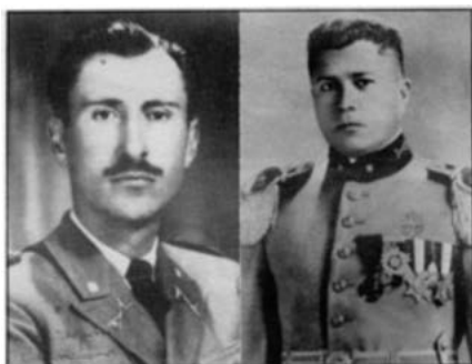
Mayor Leonidas Plaza Lasso, mentalizador y forjador del ataque al enemigo en Panupali.

gento Julio César Alvear (+), describió las facetas más importantes de lo que fue el combate de Panupali, en los siguientes términos: El ejército peruano preparó la invasión al Ecuador, en 1939, mediante la estructuración del Agrupamiento del Norte, con 15.000 efectivos de aire, mar y tierra (versión del general peruano Miguel Monteza Tafur). En enero de 1941, el comando peruano decide iniciar la premeditada invasión el 5 de julio. Las posiciones de la frontera Sur, guarnecida por los batallones Cayambe y Montecristi, fueron vulneradas. Hasta el 26 de julio del referido año se resistió la embestida de las tropas peruanas. Para esa fecha los países mediadores habían acordado el cese del fuego, pero el mando peruano no acató aquella disposición.