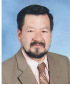
Por: Jorge Ordóñez Quezada