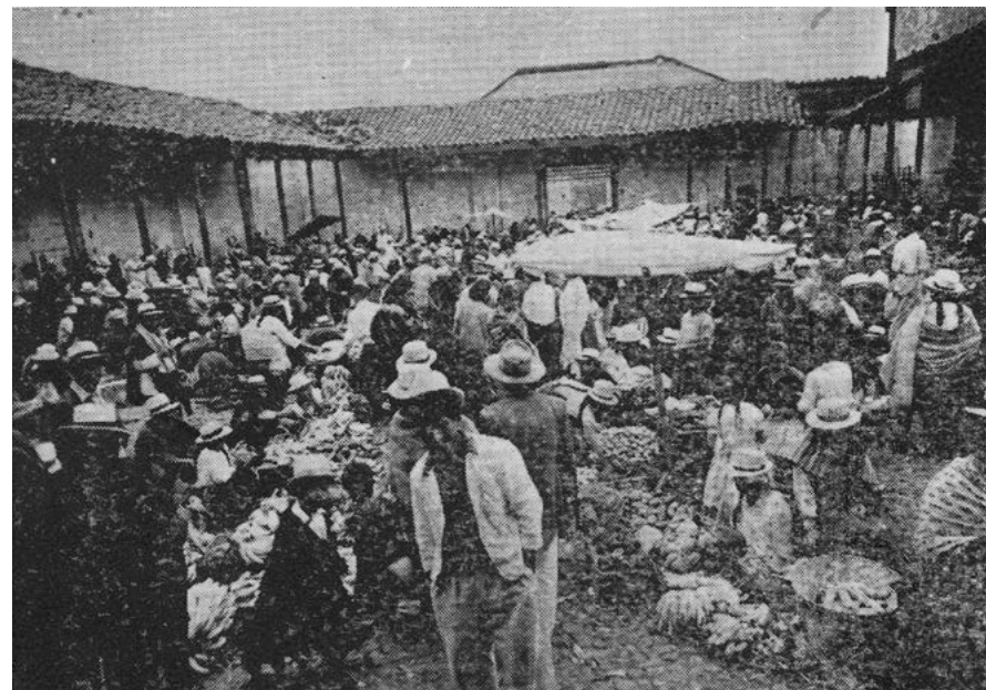
“Un aspecto de la Feria Dominical” de 1957, el lugar corresponde a donde hoy se levanta el altar mayor de la iglesia de Girón.