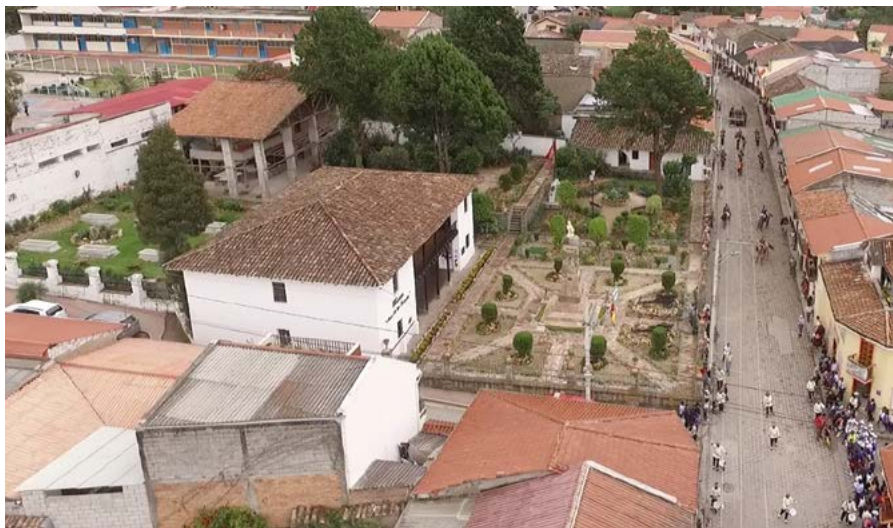
Vista aérea de los trabajos inconclusos tras de la casona del Museo Casa de los Tratados.