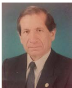
Por: Julio Espinoza C.

En el suplemento “La Pluma” de Diario El Tiempo (octubre 31 de 1992), el sar-