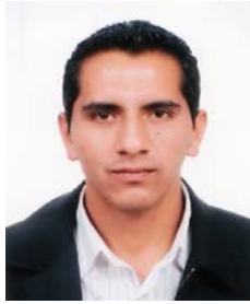
Por: Fausto Avila Campoverde