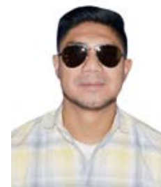
Por: Alfredo Toledo V.

Las grandes instituciones jamás están de paso, perduran para siempre. Sin lugar a dudas que Liga Deportiva Cantonal cumple esta condición y en su aniversario sesenta se arraiga más en los corazones y sueños de los deportistas de Girón.