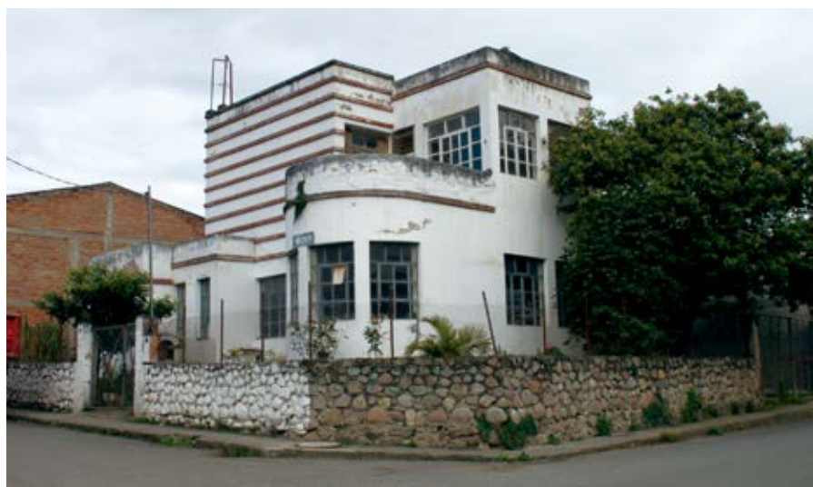
El 29 de marzo de 2017, el Ministerio de Salud Zonal 6 donó el inmueble al GAD Municipal de Girón

El Municipio de Girón en los años 50 abre un consultorio médico gratuito, de cuyos médicos que sirvieron recuerdo al Dr. Vicente Arriaga y posteriormente al Dr. Gerardo Jaramillo, que daban atención a la población del centro cantonal.