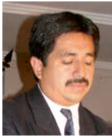
Por: Dr. Patricio Guaricela Cáceres

Escribir sobre El Sindicato de Choferes de Girón que, hoy por hoy constituye un legado histórico para el cantón y encontrar la huella que siguió en el camino de su consolidación, ciertamente requiere de investigación de la información que permita abordar el tema en forma verás y concluyente; más, la carencia de documentos informativos podría provocar la omisión involuntaria de hombres y hechos trascendentales. Entonces, hacerlo aún a riesgo de tales omisiones, ha significado una tarea más allá de lo previsible.