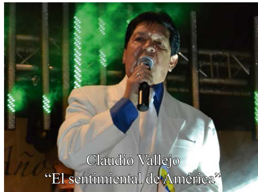
Por: Lcdo. Silvio Abad Vallejo

1. PAN | 2. MOISÉN | 3. AFÁN | 4. ESCUDILLA | 6. TROMPO | 7. VIEJO | 9. EMAICJ | 10. GUSTAR | 11. MAPANA- GUA | 12. LARRAZABAL | 15. ARCA | 18. RE | 20. OLA | 23. MÁCHICA | 25. ECO | 27. INMENSO | 30. COIMA 31. CILANTRO | 32. LEGUAN | 37. GALLO | 40. SETENTA | 41. CELESTE | 43. DISPENSARIO | 44. EVA | 47. LETRAS 49. NABÓN | 53. BLANCO | 54. CULTURA | 56. SUCUS | 58. NARANJA | 59. SERENO | 62. REO | 63. PANELA 65. PASTA | 66. ESA | 67. LA | 68. ARPA | 70. ESE | 71. SOL | 75. CORPUS | 77. LIA | 79. LÉNTAG | 80. GUAMÁN 81. POTRO | 82. COLIBRÍ | 83. CAPILLA | 84. YUCA | 85. OGRO | 86. LONA | 88. SAL | 89. CARGO | 93. IMÁN 97. ARDE | 99. AMO | 101. TÍA | 104. MAL | 105. SÍ | 106. OR | 112. CLAUDIO.