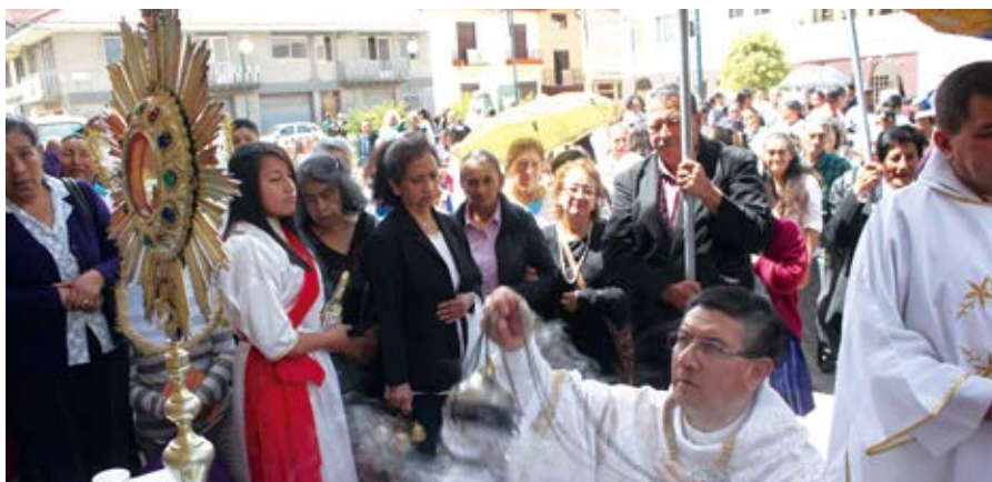
Procesion del Santísimo Sacramento, 15 de junio de 2017

esos tradicionales dulces. Ahora en Girón no hay cultivos de achira, ni siquiera las útiles para los tamales. Suspiros, dulces de almidón y roscas azucaradas llenaban las mesas ubicadas en los portales de la calle Antonio Flor.