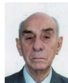
Por: Dr. Claudio Peñaherrera Mosquera

En el Ecuador existen varios modelos de práctica médica: a) Científico, Formal, Institucional; b) Aborigen, Informal, Comunitario; c) Popular, Urbano-Marginal.