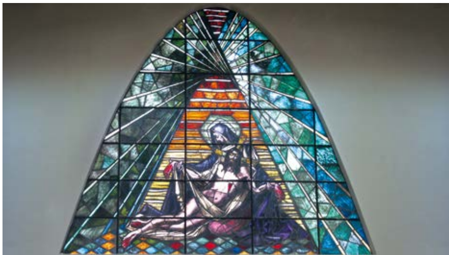
Vidriera “La Piedad” de la Iglesia Matriz de San Juan Bautista de Girón, cuyas dimensiones son 3,70 x 3,60 m.