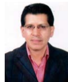
Por: Marco Salamea Córdova

Una vez que el Consejo Nacional Electoral (CNE) negara el recuento total de los votos de las elecciones del 2 de abril, y ratificara con un recuento parcial el triunfo de Lenin Moreno, le ha correspondido a éste asumir una gestión gubernamental que estará plasmada de varios problemas.