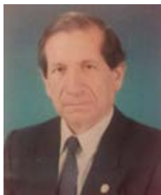
Por: Julio Espinoza C.

El Corpus Christi en Girón es una festividad de contenido religioso y cultural que se cumple durante la semana del 15 de junio de cada año, en la que se venera a la imagen del Señor de Girón, advocación que congrega a centenares de creyentes del cantón, la provincia y la región. Ceremonias religiosas, actos culturales, ferias que reactivan el comercio local y otros eventos populares son parte de esta festividad. Esta celebración se remonta al siglo XVI (1582).