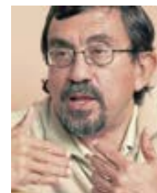
Por: Ernesto Cañizares Aguilar

El centralismo ha sido una constante en el desarrollo de los países de la Región. “Todos los caminos conducen a Buenos Aires” se decía en Argentina. O a Lima en el caso peruano. Parangonando se podría decir que en el Ecuador del siglo pasado “Todos los caminos conducen a Guayaquil”, por ser el puerto principal por donde entran y salen las mercancías. Pero en el caso ecuatoriano, también los caminos conducen a Quito, el centro burocrático de la República. Entonces, podría hablarse de un “bicentralismo”, matizado además por un marcado “regionalismo” producto de las discrepancias culturales y de los intereses de los sectores dominantes en cada ciudad.