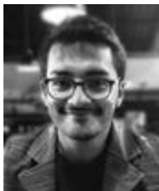
Por: Andrés Vladimir Mazza

Para ella es una actividad más, que se complementa con el pan y los dulces de almidón que hace a diario. No le da mucha importancia al queso que elabora desde hace casi medio siglo. Y por esa misma razón, se sorprende cuando quiero hablar con ella del alimento que acompaña al café de la mañana o al aperitivo del atardecer de los «gironenses».