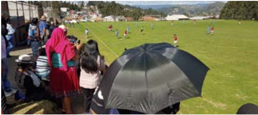
El equipo del club San Pedro del Pongo debutó en el Campeonato Provincial de Fútbol de Segunda Categoría el 3 de mayo de 2019 en el estadio Suárez de Huizhíl de Cuenca.