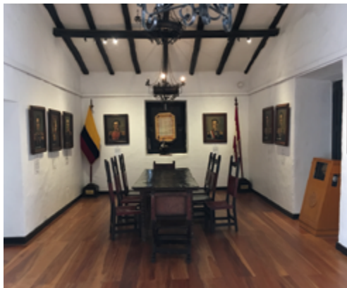
Mesa donde se firmó el Tratado del 28 de febrero de 1829.