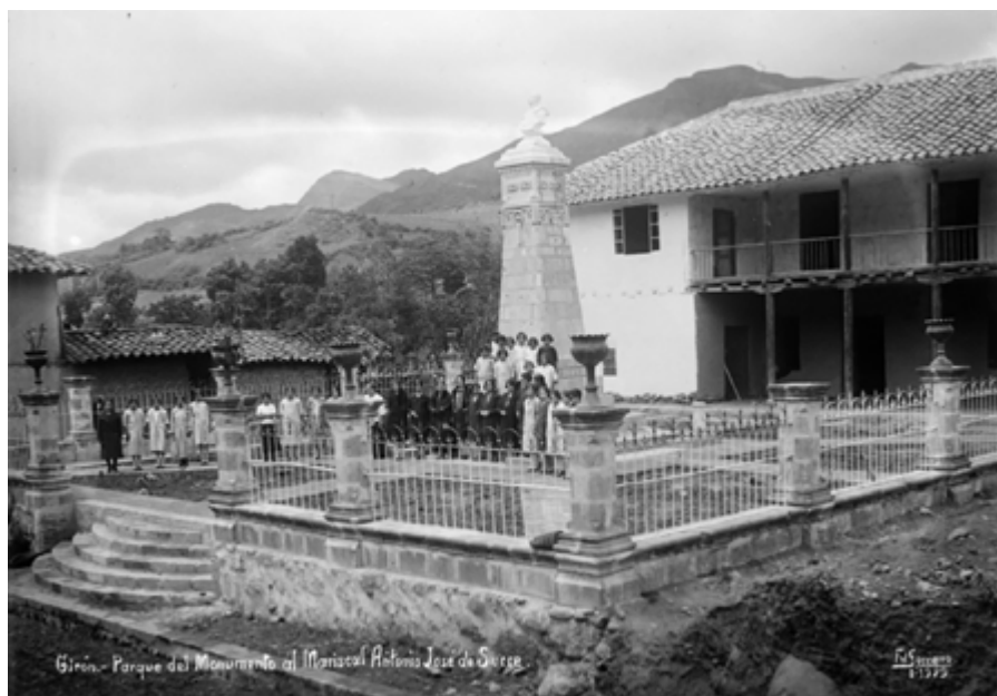
La Casa de los Tratados en el año de 1929.

Desde entonces, Girón cuenta con un Museo de Sitio que lo administra el Ministerio de Defensa con el incremento constante de bienes museísticos y donde se pueden admirar armas, uniformes, estandartes, documentos utilizados en la conflagración bélica así como una artística galería de óleos de los personajes de la gesta histórica.