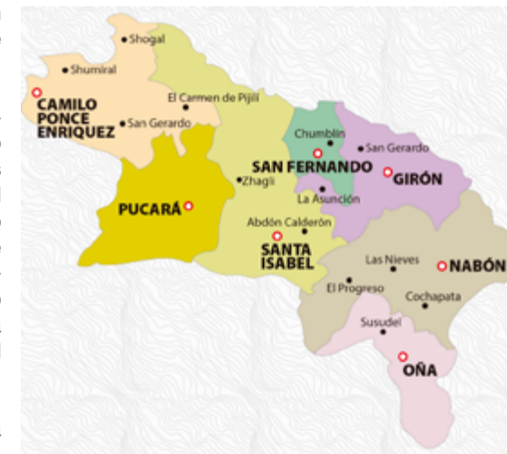
El mapa que ilustra esta síntesis histórica, con los actuales cantones de Santa Isabel, Camilo Ponce Enríquez, Pucará, San Fernando, Nabón y Oña, grafica lo que territorialmente se ha reducido Girón.

Luego de consignar estos datos estadísticos, es justo suponer que los pueblos aspiren un mejoramiento sustantivo que se vincule a su jerarquía cantonal; por lo mismo, cabe la comparación del padre de numerosos hijos para cuyas satisfacciones de necesidades no alcanza el presupuesto familiar. En definitiva, unos y otros: los que se fueron y los que quedan, tienen la oportunidad de crecer en todo orden.