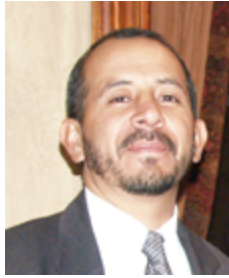
Por: Manuel Vallejo Chávez / Fuente: Periodística

Cuando nos disponíamos a festejar el fin del año 2019, a finales del mes de diciembre, los medios de comunicación del planeta, daban a conocer que en la ciudad de Wuhan (provincia de Hubei, China) se registraba una aglomeración de casos de neumonía, que posteriormente se determinó que estaban causados por un nuevo coronavirus denominado COVID-19, sin imaginar las consecuencias fatales que provocaría a nivel mundial.