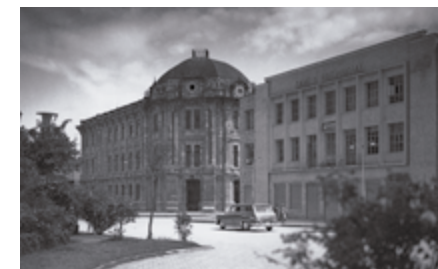
Edificio patrimonial de la Corte Provincial de Justicia.

Ahora, todos estamos a la espera de que se expida el Reglamento y Estatuto de Funcionamiento así como la integración del Consejo Directivo y, naturalmente, lo relativo a personal, bienes, presupuestos y recursos para el óptimo funcionamiento a partir del mes de mayo de 2021. Todos estaremos, insisto, tras el cumplimiento de la ley y el funcionamiento de un organismo para el bien del país.