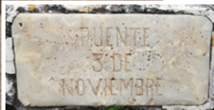
El puente "Tres de Noviembre" lleva una placa inscrita con éste nombre, sin embargo su verdadero nombre es puente "Todos Santos", así consta en una ordenanza municipal emitida en el año 1951.

su diversidad sonora el pueblo conocía o se informaba de los acontecimientos que ocurrían en su comarca (sepelios, siniestros, algarabías populares, etc)