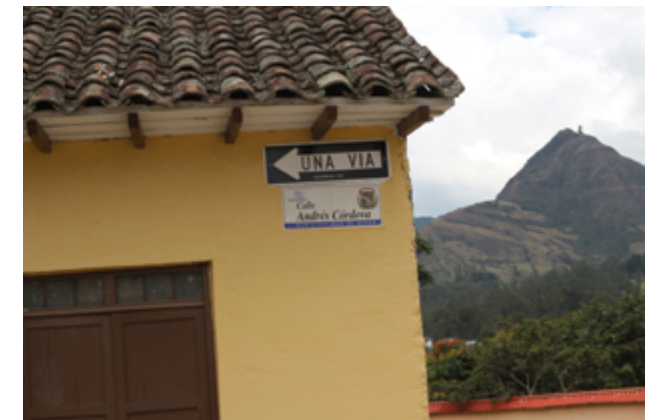
El nombre "Andrés Córdova" existente en la nomenclatura de las calles de Girón e impregnado por el Municipio de Girón, no corresponde a la nominación dada mediante ordenanza de la misma institución.

Dejémoslo allí; pues, hay tantos y tantos otros bienes históricos que han desaparecido o han tomado ignorados rumbos con destino a la destrucción o a las colecciones particulares.