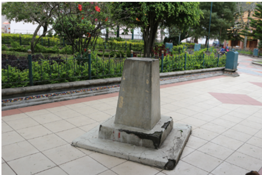
Hito y placa (pag. 8) existente en el obelisco construido en 1936 dentro del parque central 27 de Febrero, por la Misión confirmatoria presidida por el sabio Paul Rivet.