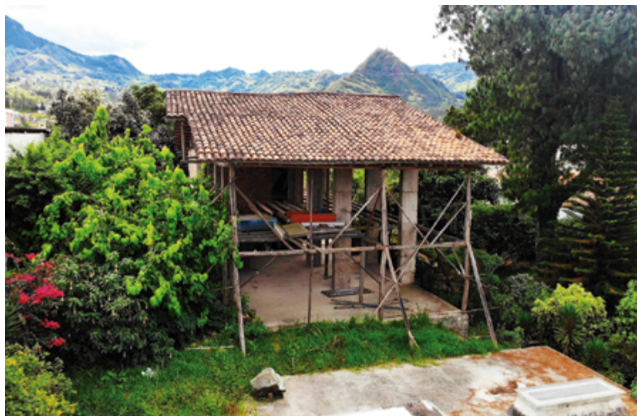
En avanzado estado de deterioro se encuentra la construcción inconclusa en la parte posterior de la "Casa de los Tratados".

El Elefante Blanco no aporta nada, se convierte en algo inútil para quien apostó por él como proyecto.