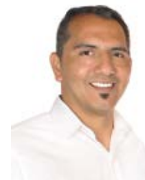
Por: Fausto Avila Campoverde

En los últimos años Girón empezó a ilusionarse con el rey de los deportes; pues, desde el 2018 el Club Academia (AKD) incursionó en el Campeonato Nacional de Fútbol sala y en el presente año el Club Deportivo San Pedro del Pongo participa en el Campeonato Provincial de Fútbol. Señalemos algunos detalles de estos sueños deportivos.