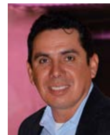
Por: Efrén Guzmán

A principios del año 1971, mucha gente comenzó a emigrar en diferentes direcciones y generalmente motivados por la difícil situación económica; es así como el 23 de abril del citado año, llega a Toronto - Canadá un grupo de personas que marcan el comienzo de la migración a ese país en donde el salario del trabajador no calificado se estipulaba en uno punto sesenta dólares la hora. A partir de entonces, reitero se inició la ola migratoria; pues, semanalmente llegaban coterráneos desde distintos puntos del Ecuador y, particularmente, de Girón muchos, naturalmente eran cabezas de familia que