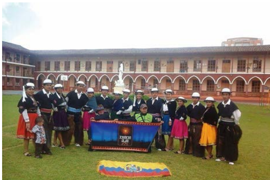
El grupo Sentimiento Andino, participó en el “Carnaval de Negros y Blancos”, que es la fiesta más grande e importante del sur de Colombia. Pasto-Nariño-Colombia, 5 de enero de 2018.

Nos encontramos permanentemente investigando las diferentes tradiciones de nuestros pueblos para hacerlas conocer a nuestros jóvenes y niños que se están olvidando de nuestras raíces, identificándose con culturas del extranjero. Los proyectos son continuar haciendo nuevas coreografías para seguir internacionalizándonos, no sólo a nivel de Sudamérica sino también en Norteamérica y Europa.