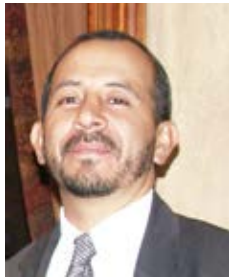
Por: Manuel Vallejo C.

“Número a número, con puntualidad y con paso cada vez más firme, viene apareciendo cada seis meses su Revista GIRON 360°...”, empezaba diciendo el editorial de la publicación N° 8 de diciembre 20-2018, de este prestigioso medio de comunicación, que se publica en los meses de junio y diciembre de cada año, con ocasión de la recordación de su cantonización (25 de junio de 1824) y declaratoria como Patrimonio Cultural de la Nación (20 de diciembre de 2006), respectivamente.