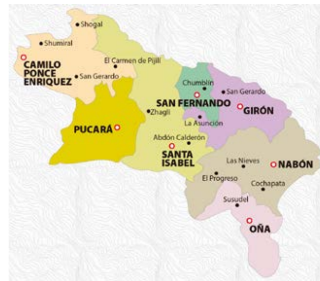
El mapa que ilustra esta síntesis histórica, con los actuales cantones de Santa Isabel, Camilo Ponce Enríquez, Pucará, San Fernando, Nabón y Oña, grafica lo que territorialmente se ha reducido Girón.

Después de Santa Isabel (1945), San Fernando alcanza categoría cantonal el 6 de mayo de 1986. Chumblín es la única parroquia adscrita a este cantón. Nabón es cantón desde el 7 de julio de 1987, con las parroquias Cochapata, Las Nieves, El Progreso y Oña, en principio. Pero luego de desacuerdos con Nabón, el 10 de mayo de 1992 Oña se separa y se erige como nuevo cantón. Su parroquia