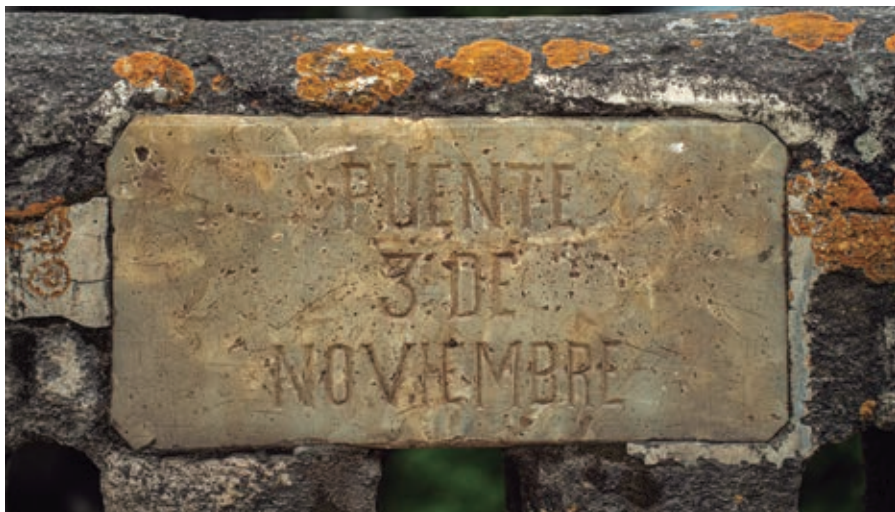
Placa incrustada en el puente "Todos Santos".

Girón posee más de cien espacios públicos que cuentan con su respectiva nominación, mayoritariamente son calles, pero también están puentes, escenarios, escalinatas, vías de retorno, hasta pasajes; sin embargo, es desconocido desde cuando están incorporados honoríficos recuerdos que tenemos los gironenses y no todas estas áreas cuentan con una placa que estampe el nombre adjudicado.