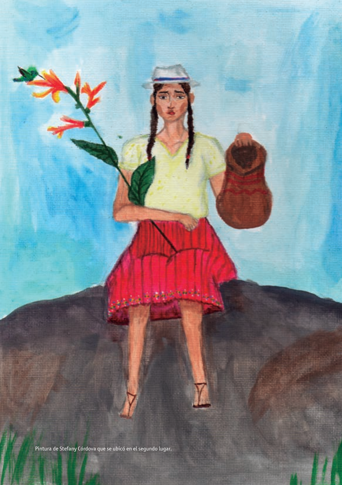
Pintura de Stefany Córdova que se ubicó en el segundo lugar.