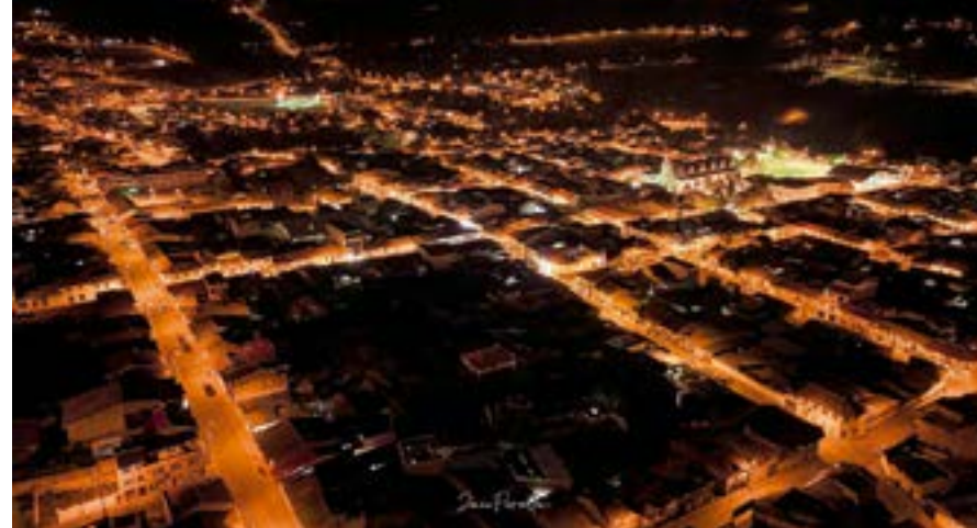
El centro cantonal de Girón está conformado por 13 barrios.

Uno de los desafíos más grandes fue la implementación del Punto Seguro en el sector de La Cruz. A partir de marzo de 2023 se organizaron jornadas de recaudación de fondos en la avenida principal, mingas de limpieza y pintado del espacio destinado, elaboración de proformas, búsqueda de apoyo institucional y socialización en cada barrio. Tras un año de insistencia, cambios administrativos en las instituciones (Municipalidad, Jefatura Política, Comisaría Nacional, Policía Nacional), el proyecto se consolidó en marzo de 2024, cuando se realizó la entrega-recepción de los insumos adquiridos con aportes comunitarios, actividades barriales y donaciones, sumando un total de USD 1.513,59 recaudados e invertidos. Desde ese momento, el espacio otorgado por la municipalidad quedó habilitado, la Policía Nacional asumió su funcionamiento y la empresa local "Girón y Chavelo TV" colaboró proporcionando internet gratuito para este fin. Además, en materia de seguridad, se logró activar chats comunitarios en los barrios y un