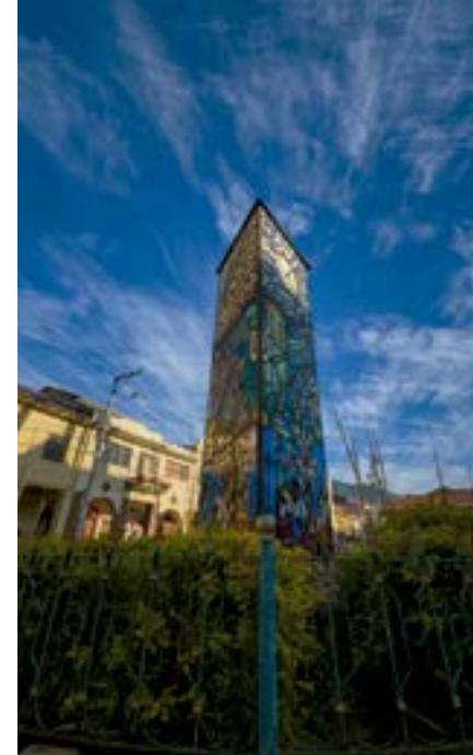
El 27 de febrero de 2008, en Girón, se inauguró el monumento al Migrante, que fue construido bajo el auspicio del Comité Achiras de New York.

El estado, en sus distintas instancias, debe convertirse en un sujeto activo y no meramente reactivo en el manejo del tema migratorio. La población migrante debe ser escuchada y formar parte activa en la estructuración de las políticas públicas que definan el uso de recursos destinados a posibilitar que las migraciones, dentro de lo posible sean libres, planificadas, informadas, seguras, ordenadas y dignas. Cualquier alteración de estas condiciones podría provocar la erosión irreparable de la dignidad y hasta atentar contra la vida del migrante y el ideal de que las migraciones estén siempre cobijada por todas estas condiciones sigue siendo una utopía y esta es la razón por la