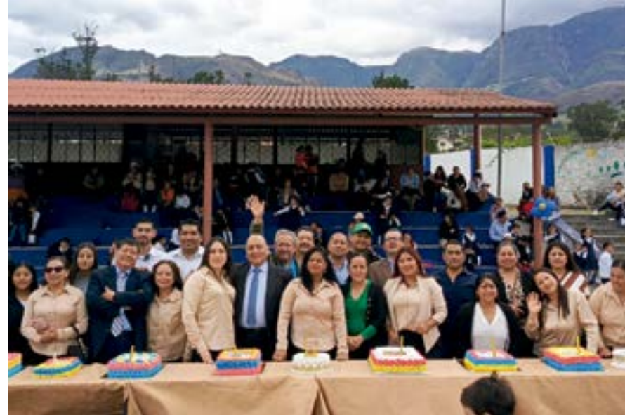
El 17 de octubre, la comunidad educativa de la Escuela de Educación Básica Antonio Abraham Barzallo celebró sus bodas de oro.

Los trabajos de edificación de las aulas inician el mes de diciembre de 1980