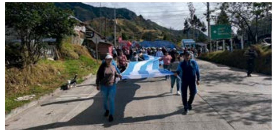
El 1 de octubre, en Girón se desarrolló una marcha en contra de la actividad minera y a favor del agua.

Las críticas crecieron, ETAPA EP advirtió errores técnicos en los estudios de impacto ambiental y varios colectivos denunciaron que el Estado estaba ignorando la voz de la ciudadanía.