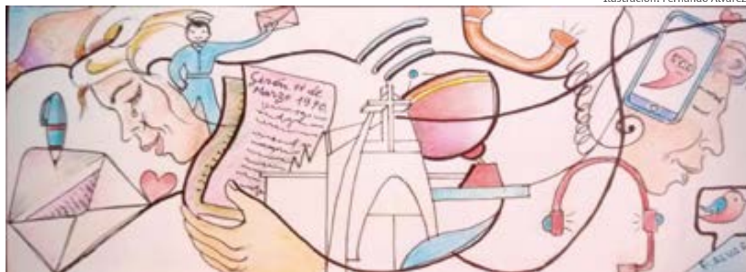
Ilustración: Fernando Álvarez B.

Por cartas o por telefonía convencional, la comunicación era indispensable y ésta mantenía latente la sensación de distancia y de ausencia, generando, irremediablemente, nostalgia, añoranza y, a veces, sentimientos de desarraigo en todos los sujetos cobijados por el paraguas de la migración. una revolución en la forma de comunicarnos, aliviando inmensamente los efectos de la ausencia y la distancia y generando condiciones de virtual presencia e inclusión en las decisiones trascendentales, aportando bienestar en las familias transnacionales.