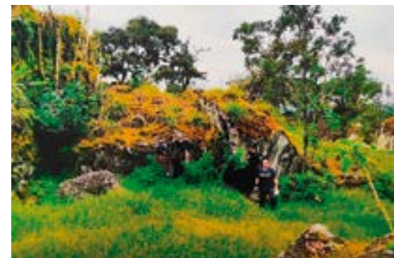
Abrigo bajo roca y su entorno, dentro del “Bosque de Piedra”, en donde se observa la entrada a la “Cueva del Brujo”, comunidad Pueblo Viejo, parroquia La Asunción, cantón Girón.

El vestigio litográfico más grande y representativo del yacimiento arqueológico de Chiniyacu, por sus numerosos y variados diseños, mide 2,70 metros de largo por 1,50 metros de ancho, forma rectangular, fisurada aproximadamente en la parte central; superficie bastante meteorizada y cubierta de una pátina de magnesio y litolíquenes. Presenta el anverso regularmente plano, cubierto de figuras geométricas incisas, excisas de formas y medidas diferentes: zonas con figuras de pirámides truncadas rellenas de surcos, protuberancias circulares, ovaladas que encierran puntos grabados; figuras estilizadas en herradura, pescado y una serpiente de pequeñas dimensiones. La imagen más importante constituye un hoyo con reborde circunferencial y radiaciones en altorrelieve a