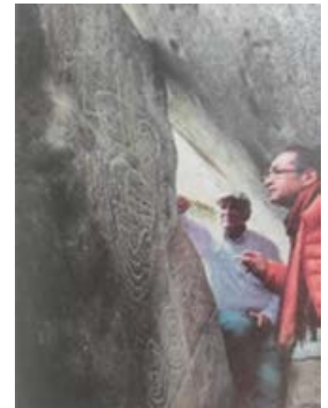
Petroglifo. "La Cueva del Brujo", ubicado en el "Bosque de Piedra", contiene petroglifos grabados prehispánicos. Sector Pueblo Viejo, parroquia La Asunción, cantón Girón.

En la gran mayoría de las grandes piedras en seco de forma irregular, pesan desde unos pocos kilos, hasta más de tres quintales de peso, están colocadas unas sobre otras, guardando