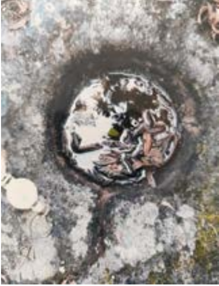
Espejo de agua, en un hoyo cóncavo de Piedra, donde se reflejan los astros, dentro del contexto del más grande de los petroglifos, en el sitio arqueológico de Chiniyacu, sector Tunca, parroquia La Asunción, cantón Girón.

manera de dedos, presumiblemente representativo del Sol. Se trata de un hoyo de 30 centímetros de diámetro por 15 centímetros de hondo, excavado y pulido con material abrasivo en forma de una perfecta semiesfera en su parte cóncava, ubicado aproximadamente al centro del petroglifo. Presumiblemente debió ser esculpido en la piedra, con el fin de que las gotas de lluvia llenen el recipiente, constituyendo en un espejo de agua astronómico. En los días claros, cuando el Sol está en el cenit, se refleja a plenitud el disco solar. Así también en las noches despejadas la imagen lunar y de las estrellas, se reflejan en el espejo de agua circular. Suponemos que el petroglifo más grande que contiene la representación del Sol, debió ser tallado el recipiente con fines de observación astronómica, cuando está lleno de agua. Acaso fue un altar ceremonial, del grupo étnico primitivo que acampó y/o vivió en esta comarca.