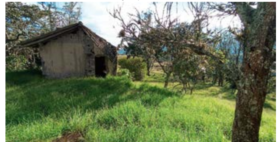
Estado actual de la casa de habitación de la familia Delgado Espinoza en la comunidad de Moisol .

El fruto extraído de la tierra, era acarreado cerca de la casa en costales, unos 10