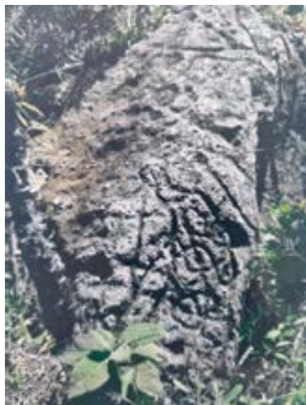
Petroglifo tallado en alto relieve, ubicado en el sector Chiniyacu, comunidad de Tuncay, parroquia La Asunción, cantón Girón.

Casi la totalidad de los muros de piedra están erigidos de manera rudimentaria. Se conoce por información tradicional, que algunos muros de piedra fueron construidos por peones de los antiguos hacendados y dueños de pequeños predios, para delimitar sus propiedades, a la vez servían de cercas de los potreros.