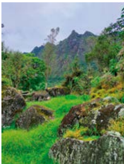
Primer plano, parte del 'Bosque de Piedra' donde se encuentra 'La Cueva del Brujo'. Al fondo se erige el majestuoso cerro Quillotuñi.

constituye una loma de piedras de pocos metros de altitud, formada por la acumulación de materiales originados a partir de una avalancha de nieve y piedras de gran magnitud, desprendidas desde lo alto de las paredes del cerro aledaño de Quillotuñi, probablemente en el último Período Glacial Pleistocénico; según se deduce por las marcas dejadas en la superficie de las rocas y la fragmentación mecánica causada por el hielo (gelifracción), a través del proceso de expansión y contracción térmica; así como durante el violento choque de unas piedras con otras, en el trayecto del deslizamiento de los materiales desprendidos del cerro arriba mencionado.