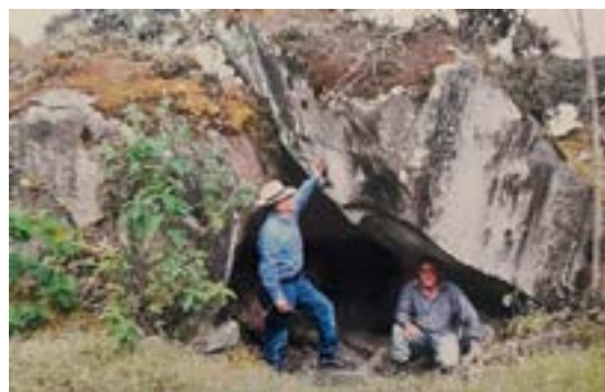
Entrada a la "Cueva del Brujo", ubicada en el "Bosque de Piedra". Sector Pueblo Viejo, parroquia La Asunción, Cantón Girón.