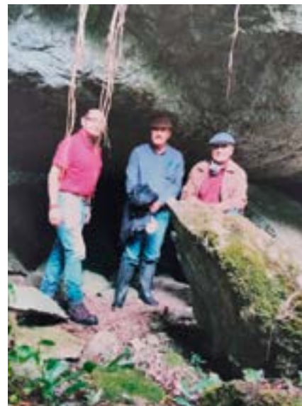
Abrigo bajo roca, ubicado en las estribaciones del cerro Quillotuñi, comunidad de Pueblo Viejo, parroquia La Asunción, cantón Girón.

Los cerros anteriormente mencionados presentan una vista panorámica espectacular de la grandiosidad de los valles de Yunguilla, San Fernando, Girón, Jubones y de las cumbres de las cordilleras Oriental y Occidental y de sus respectivos ramales que se abaten en dirección hacia los ríos Girón, Rircay, León, Jubones y Uchucay, así como de los nudos de Portete y Guagrahuma, que encierran la hoya del río Jubones.