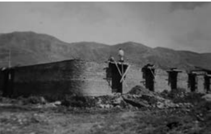
Construcción del mercado municipal, foto tomada desde la intersección de las calles Abraham Barzallo y Juan Vintimilla.

La gran paradoja de lo aquí dicho es que, ponderando, como ponderamos, las virtudes de la democracia y los buenos salarios de los funcionarios electos, para Girón, hayan resultado tan bondadosas las dictaduras y tan saludables los servicios honorarios de sus funcionarios públicos. Bien merecen nuestra gratitud quienes con civismo, honestidad y transparencia hicieron de los años setenta y ochenta una época de tangible crecimiento, desarrollo y progreso para nuestra tierra. Nostalgia restauradora o nostalgia reflexiva, es innegable que bien valdría la pena recuperar el civismo a la hora de administrar lo público.