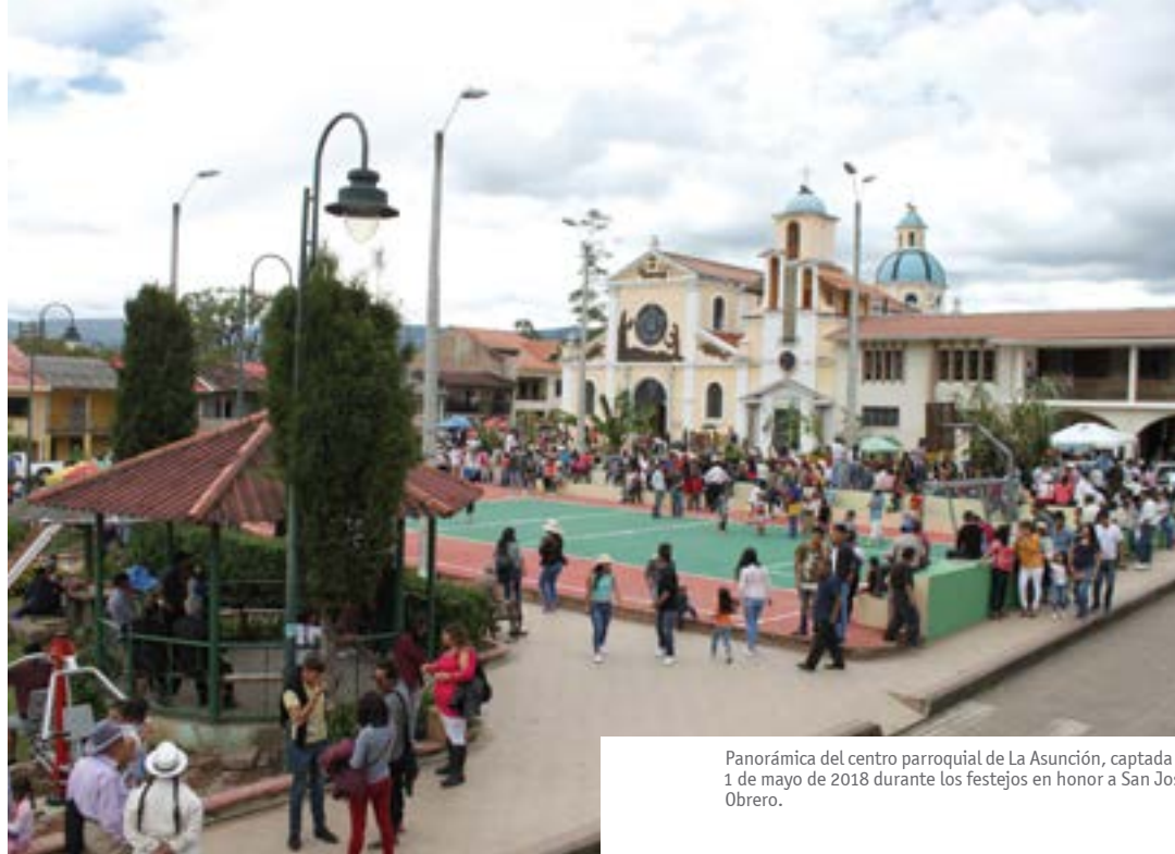
Panorámica del centro parroquial de La Asunción, captada el 1 de mayo de 2018 durante los festejos en honor a San José Obrero.

La vegetación de los sectores bajos e intermedios de la parroquia La