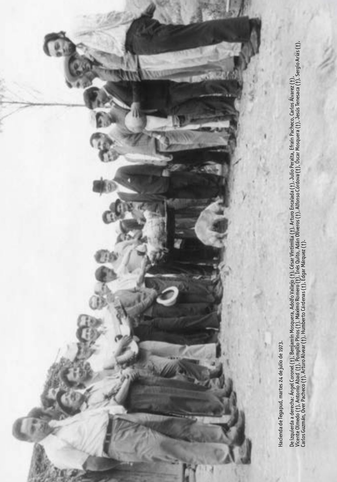
Hacienda de Tegapud, martes 24 de julio de 1973.